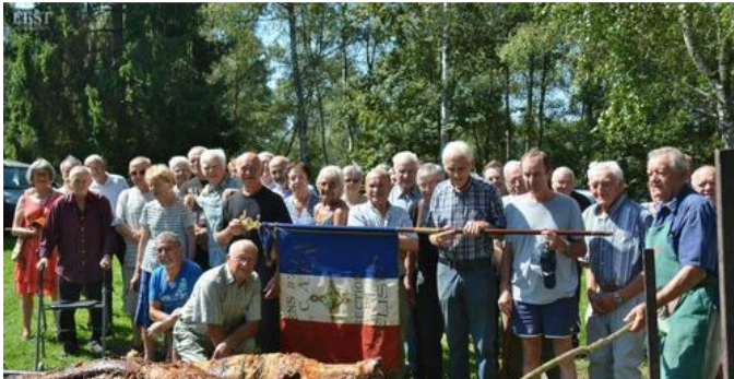
Une tradition qui perdure dans la section depuis près d'un demi-siècle