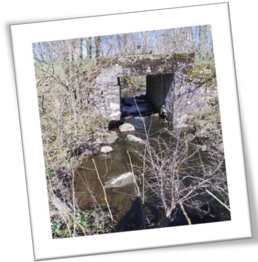
EFFONDREMENT Du pont de "CHEMNIER" du CHEVIGNEY