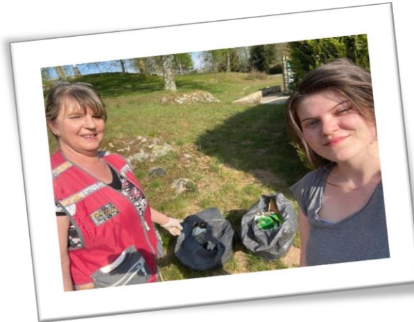
OPERATION DECHETS DANS LE FAYS 20 KG sur 3,4 Km