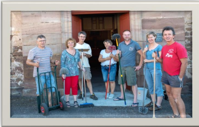
MENAGE DE PRINTEMPS A L'EGLISE EN AUTOMNE