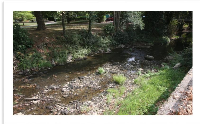
RESTRICTION D'EAU - RECHAUFFEMENT CLIMATIQUE